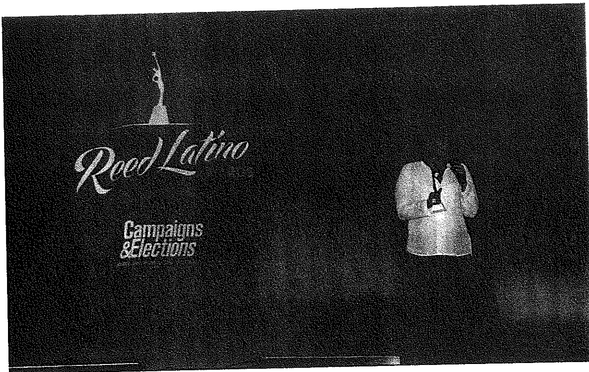
Recibiendo el premio a nombre de la H. Cámara de Diputados.